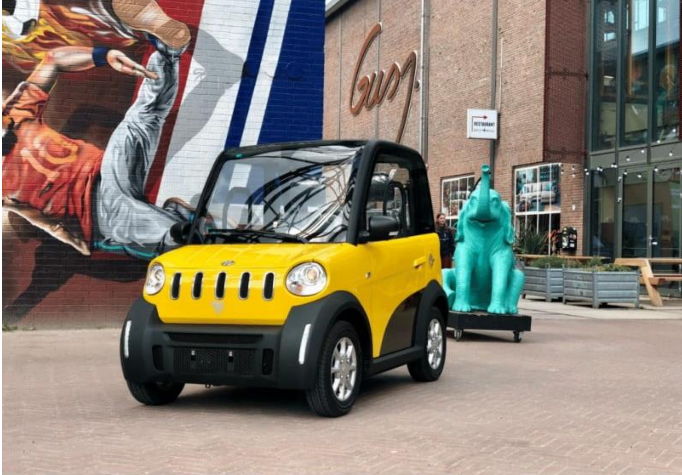
HANDLEIDING MOVE CITYCAR